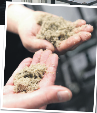
■ Producenten lover, at Daritechs system kan rense sandet op til 98 procent.